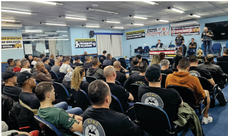
AGE do dia 15/07/2025 aprovação da pauta de reivindicações

Desde o início das negociações, mantivemos nossa posição firme: não abriríamos mão dos direitos historicamente conquistados com muita luta . Mesmo diante da intransigência patronal, que tentou impor cláusulas abusivas e prejudiciais aos trabalhadores, resistimos e mantivemos nossa CCT intacta, com todos os direitos preservados .