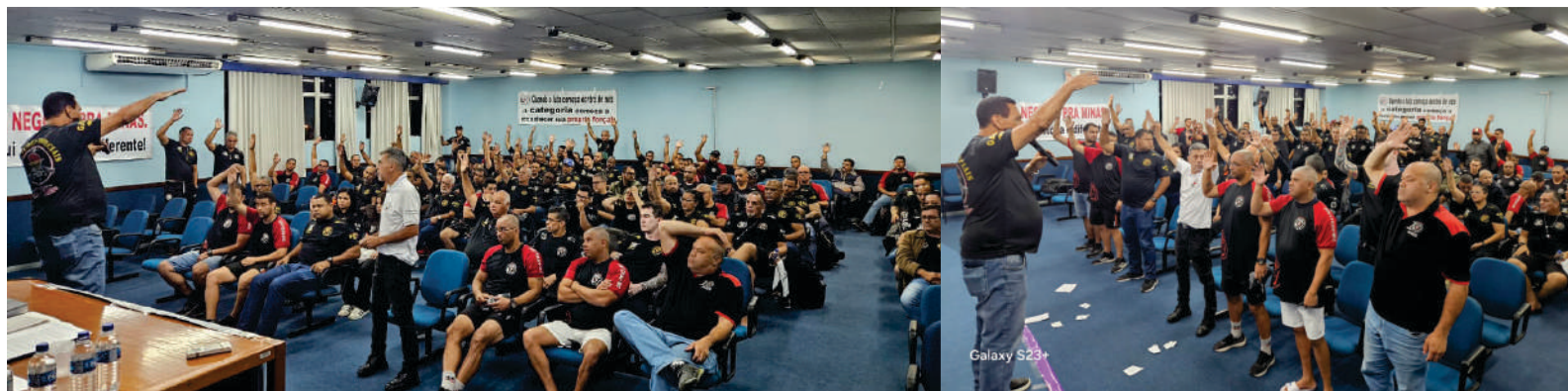
AGE do dia 13/11/2025 Assembleia de decisão

Destacamos a determinação e a consciência, especialmente dos Vigilantes do Transporte de Valores e demais trabalhadores presentes, que - mesmo após jornadas extenuantes e dias de trabalho intenso - fizeram questão de comparecer às assembleias.