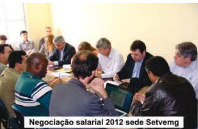
Negociação salarial 2012 sede Setvemg