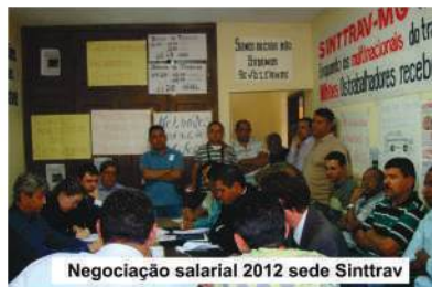
Negociação salarial 2012 sede Sinttrav