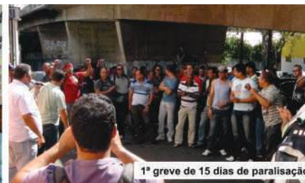
1ª greve de 15 dias de paralisação do transp. valores MG 2012